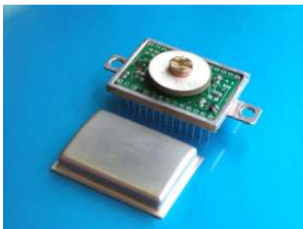
Высокочувствительный датчик угловых скоростей

Разработка приборов в рамках НИОКР, разработка и миниатюризация сейсмодатчиков, миниатюрных гироскопов, доработка конструкции и технологии сборки многослойных пленочных актюаторов для различных применений и разработка новых типов пьезоприборов на основе тонкопленочной технологии, исследование возможности создания гибридных МЭМС элементов на основе тонких пленок. Поставка опытных образцов генераторов по согласованным с заказчиками требованиям.