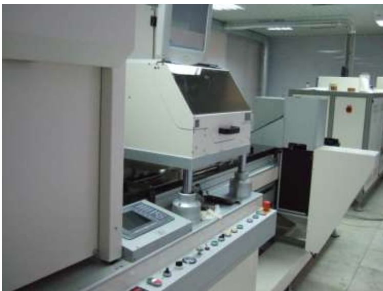
Оборудование фирмы «КЕКО» для изготовления тонких пьезокерамических пленок