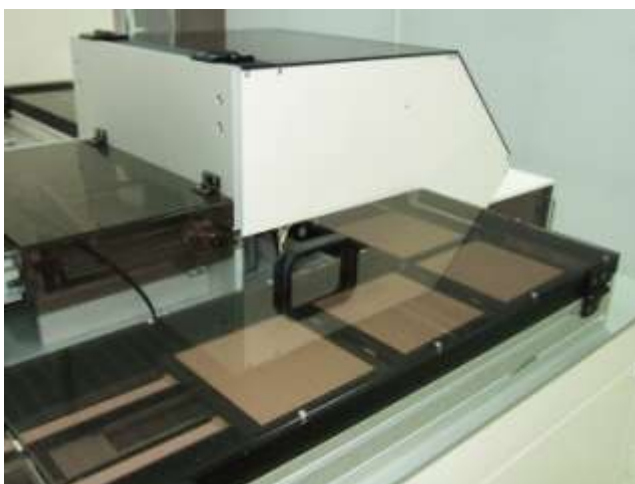
Тонкие пьезокерамические пленки

Новое оборудование замкнутого цикла полностью автоматизировано, что исключает человеческий фактор, безотходно и экологически безопасно, по сравнению с предшествующим прототипом отличается более высокой производительностью. Но главное – его появление означает технологический прорыв ОАО «НИИ «Элпа» в новые области, новые возможности не только в производстве, но и в науке.